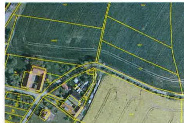
Ortofoto s obrazem katastrální mapy po obnově katastrálního operátu

Po skončení prací na obnově katastrálního operátu dochází k vyhlášení jeho platnosti. Podle § 58 odst. 2 vyhlášky č. 357/2013 Sb., katastrální vyhláška, zašle katastrální úřad sdělení o vyhlášení platnosti obnoveného katastrálního operátu obci, na jejímž území byl katastrální operát obnoven. Obec zveřejní tuto informaci v místě obvyklým způsobem. Katastrální úřad a Český úřad zeměměřický a katastrální zveřejní vyhlášení platnosti obnoveného katastrálního operátu rovněž na svých internetových stránkách.